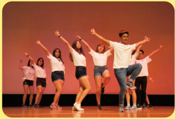
ngày học sinh