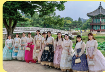
Trải nghiệm văn hóa