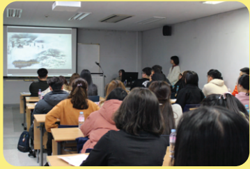
Buổi giới thiệu định hướng