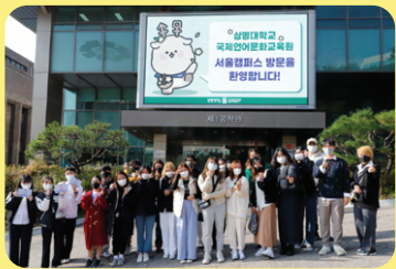
Tham quan khuôn viên trường