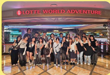
Trải nghiệm văn hóa