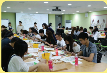
Trải nghiệm văn hóa