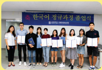
Lễ tốt nghiệp