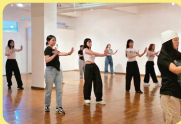
Trải nghiệm nhảy K-POP