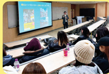
Chuyên đề văn hóa Hàn Quốc