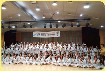
Trải nghiệm văn hóa