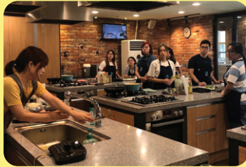
Trải nghiệm làm món ăn HQ