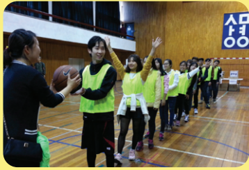
Ngày hội thể thao