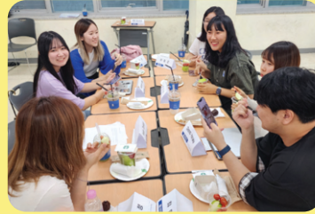
Buổi giao lưu sinh viên